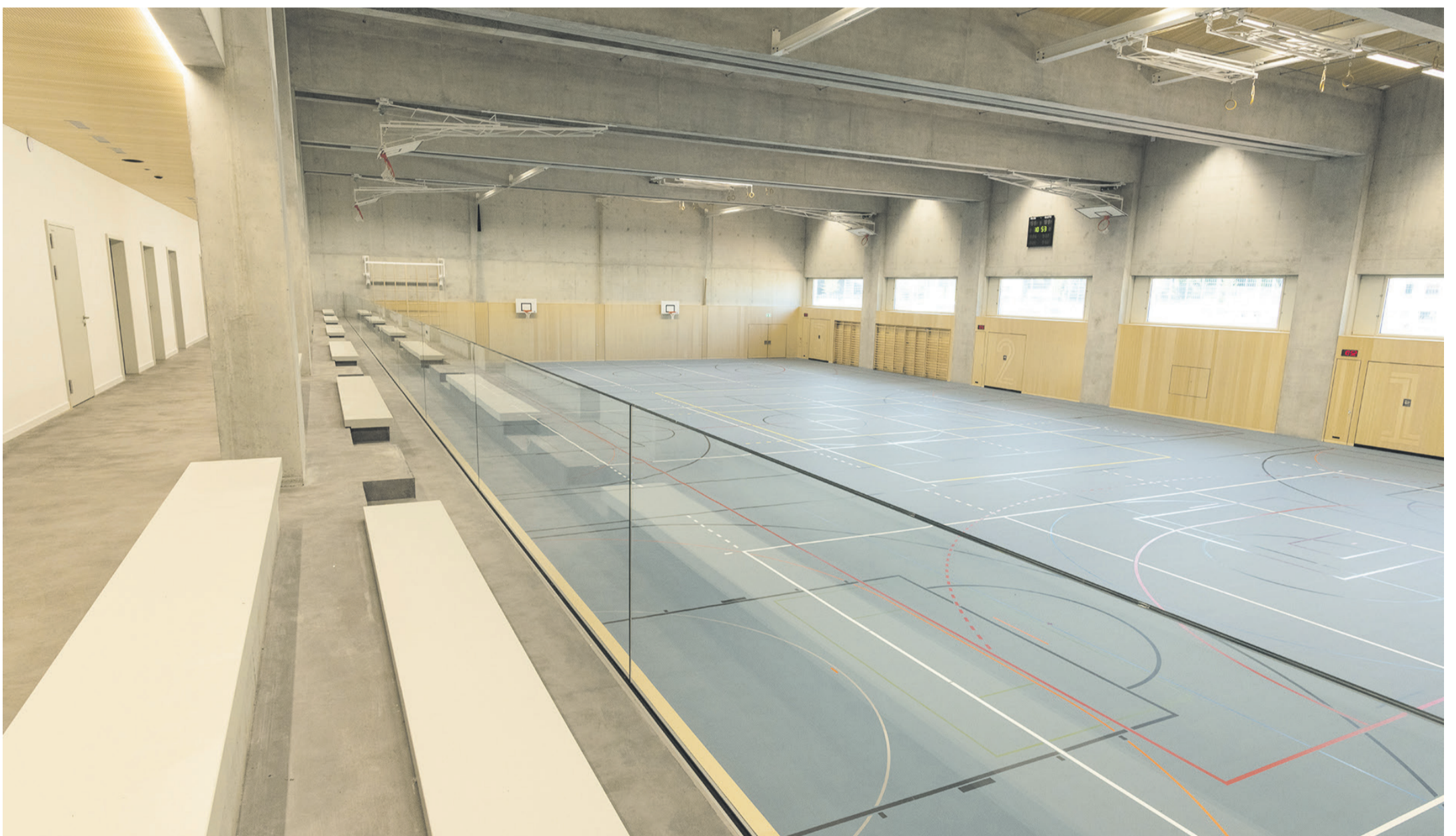
Halle und Tribüne.