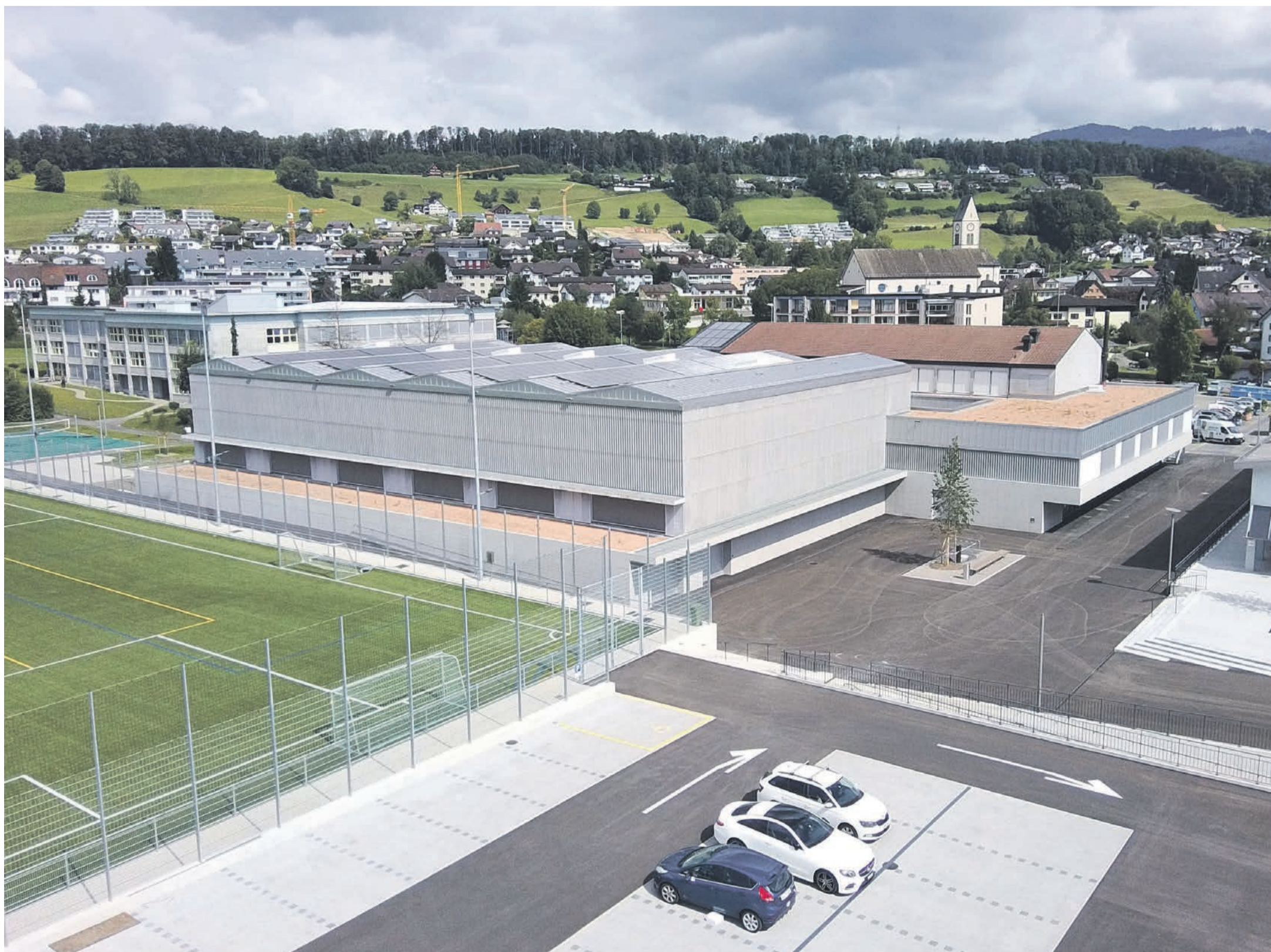
Aussenansicht inkl. Vorplatz.