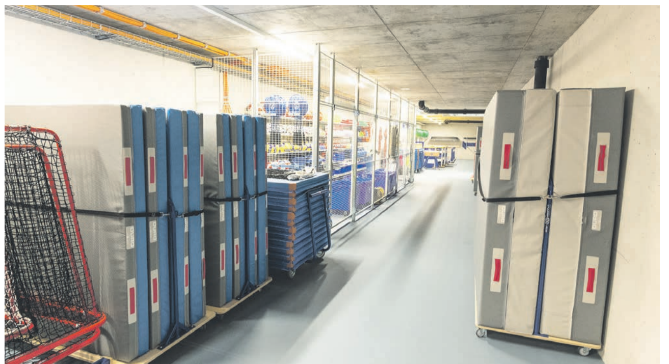
Ausrüstung für zahlreiche Sportarten.